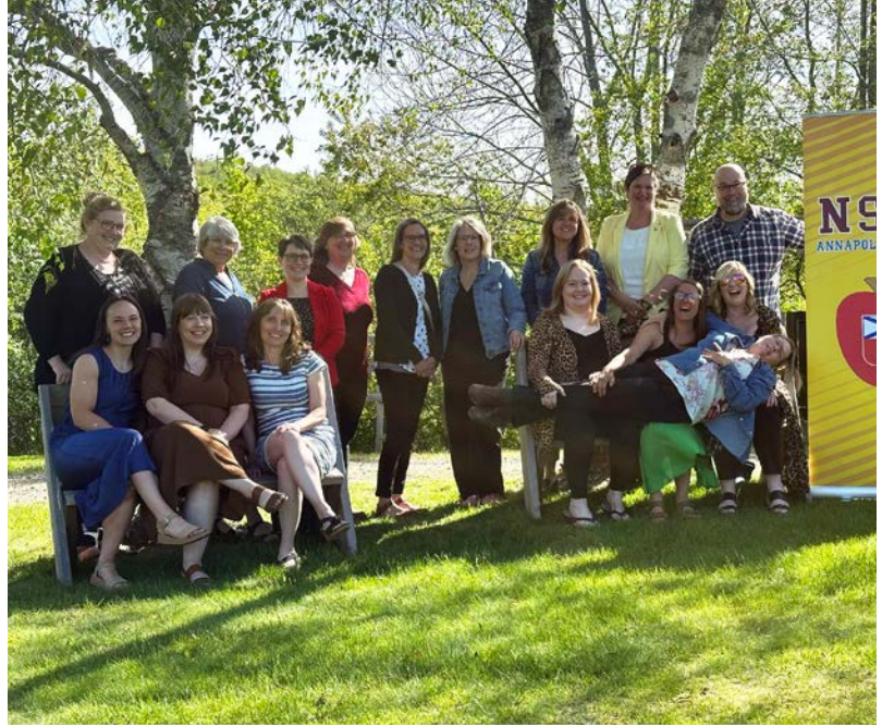
Les membres du Comité exécutif de la section locale d'Annapolis et des invité-e-s qui ont participé à la Célébration de la fin de l'année sont photographiés.