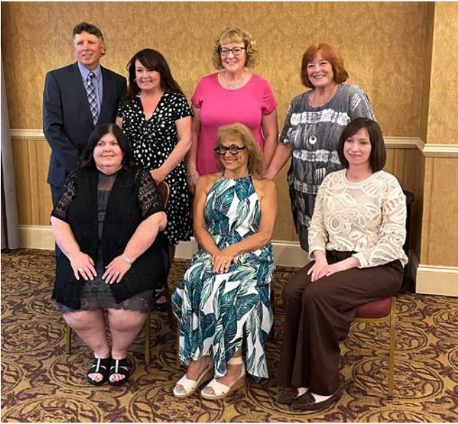
Personnes retraitées de la section locale de Colchester-East Hants.