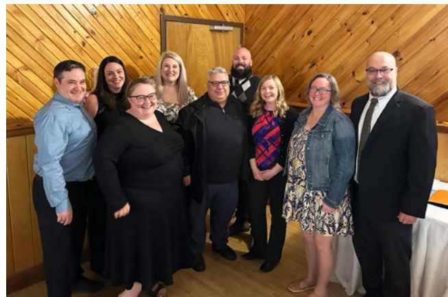
Des membres du Comité exécutif de la section locale d'Antigonish sont photographiés avec le président du NSTU Peter Day lors de la célébration des départs à la retraite de la section.