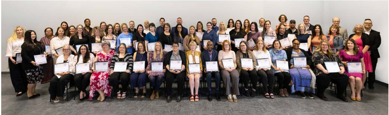
Lauréats de la Semaine de l'éducation 2026

Pour lancer la Semaine de l'éducation 2026, des enseignantes et enseignants extraordinaires de partout dans la province ont été reconnus, le 11 mai, lors d'une cérémonie à l'École secondaire Mosaïque à Dartmouth.