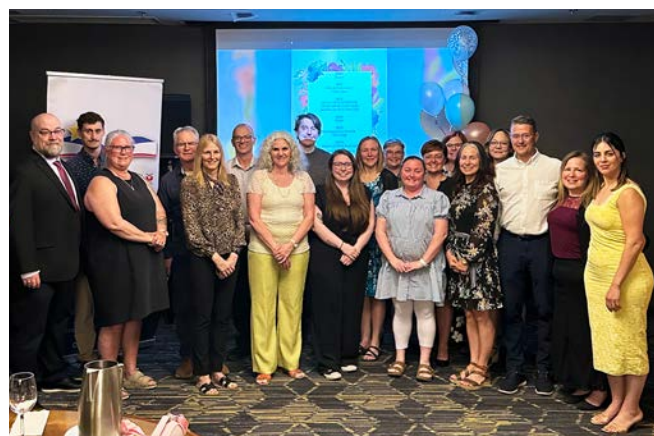
Des personnes retraitées de la section locale du CSANE sont photographiées avec le président du NSTU Peter Day. Des membres du Comité exécutif de la section locale du CSANE et des personnes retraitées sont photographiés lors de l'événement de départ à la retraite du 23 mai.