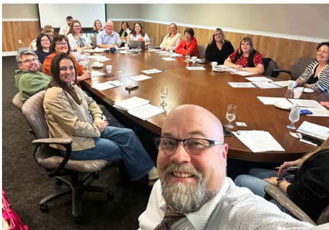
AGA de la section locale de Northside-Victoria