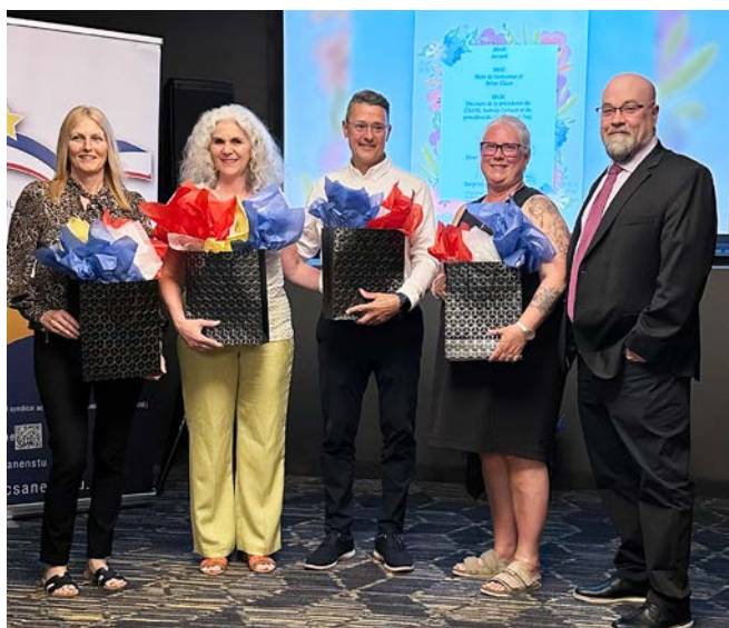
Des personnes retraitées de la section locale du CSANE sont photographiées avec le président du NSTU Peter Day.