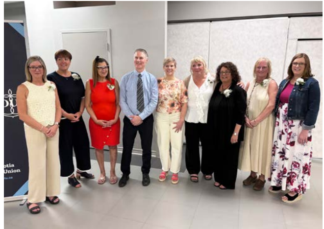
Les personnes retraitées de la section locale de Pictou sont honorées lors de la célébration soulignant leur départ à la retraite organisée par la section.