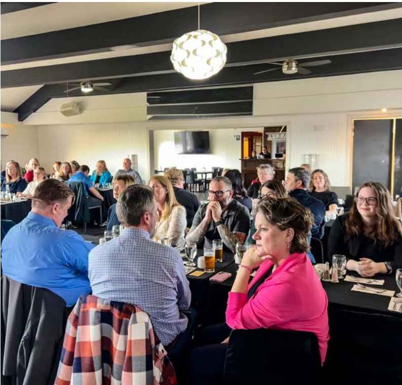
Célébration pour 25 années de service de la SLDCB.