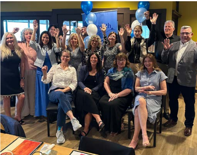
Personnes retraitées de la section locale de Dartmouth.