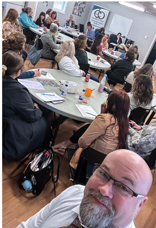
AGA de la section locale du district du Cap-Breton