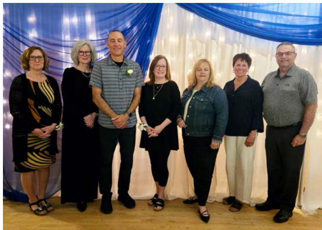
Personnes retraitées de la section locale d'Antigonish.

Partout dans la province, des membres bénévoles du NSTU organisent ces événements spéciaux des sections locales afin de souligner les carrières et les contributions des enseignant·e·s et des spécialistes.