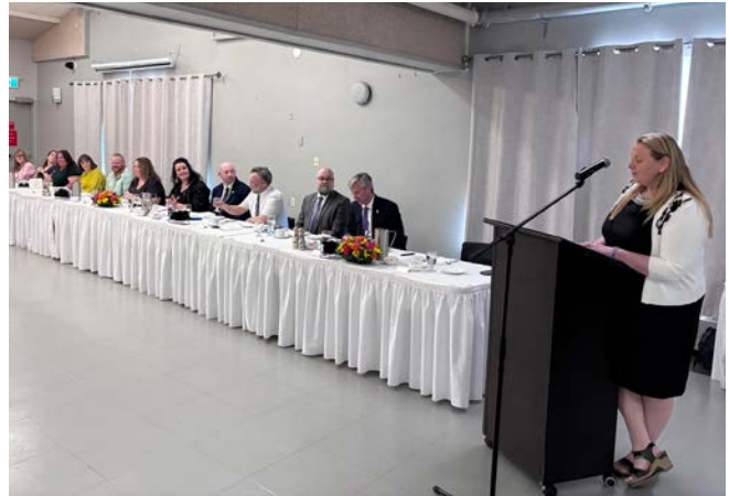
La présidente de la section locale de Pictou souhaite la bienvenue aux invité-e-s lors de l'événement pour les personnes retraitées du 4 juin. Parmi les invité-e-s à la table d'honneur figuraient le premier ministre Tim Houston et le député de Pictou-Ouest Marco MacLeod.